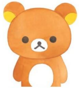
『リラックマ ここにいます』 (主婦と生活社 2015年)