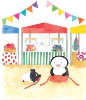
『ゆめぎんこう おまつりへいく』 (白泉社 2023年)

愛媛県松山市出身。1997年、文具会社デザイン室入社。「みかんぼうや」「リラックマ」などのキャラクター原案、商品デザインなどを担当。2003年退社後は、フリーでキャラクターデザインや絵本制作などを行う。主な作品に「うさぎのモフィ」「ニャーおっさん」「おふとんさん」など。