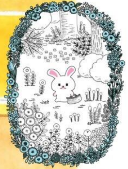
『うさぎのモフィ もりのまいにち』 (主婦と生活社 2021年)

コンドウアキの作家生活20周年を記念する本展では、デビュー作『木からおりたミカン』(みかんぼうや)から、最新作となる『ゆめぎんこう』まで、コンドウアキ作品を幅広く、網羅的にご紹介します。どこか安心するような親しみのあるキャラクターとともに、日常のなげない、愛しい時間を届ける作品の数々をどうぞお楽しみください。