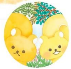
『リーとスーのどこ?どこ?どこ?』 (教育画劇 2019年)